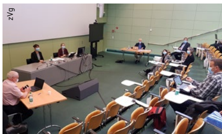
GAV-Verhandlungen während der Corona-Pandemie, hier mit den Vertretungen des Luzerner Kantonsspitals und der Luzerner Psychiatrie sowie den Verbänden SBK, VSAO, VPOD und LSPV.