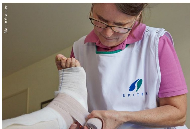
Chi paga per il materiale di cura? L'attuale regolamento deve essere modificato in base alla vecchia e comprovata prassi a favore degli indipendenti.

Informationen unter www.sbk-asi.ch > aktuell