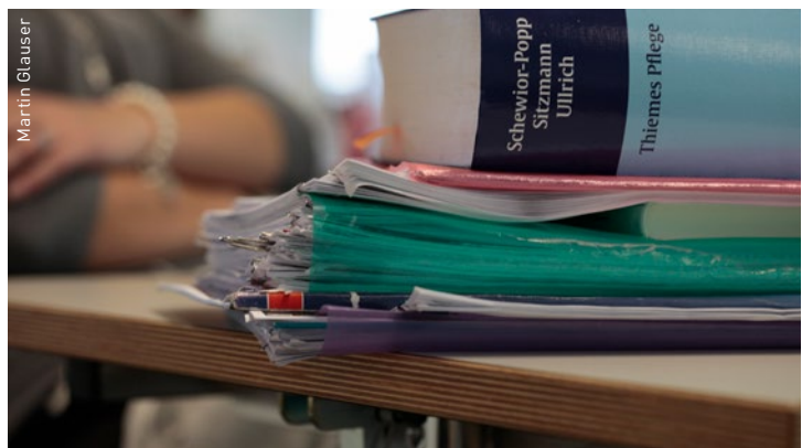
Der SBK arbeitet weiter daran, dass die Hürden beim NTE abgebaut werden.