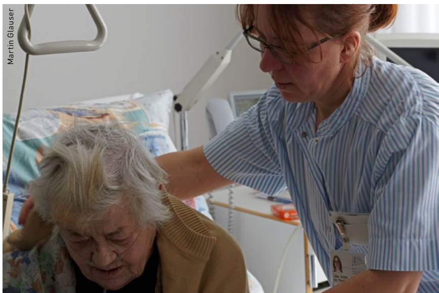
Von Rentenlücken betroffen sind auch Pflegefachfrauen in Teilzeitanstellung.