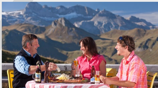
Geniessen Sie die Adelbodener Bergwelt und ein gemütliches Zvieriplättli im Restaurant Sillerenbühl.

Informations et autres offres sur www.sbk-asi.ch/exclusif